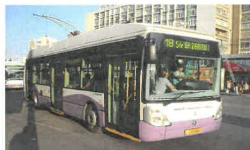
Parc inventar: 50 troleibuze SOLO- SKODA 24 TR IRISBUS

Retea Autobuze - 1.275,665 din care: 36 trasee urban - 524.175 km., 17 trasee metropolitan - 751.490 km.