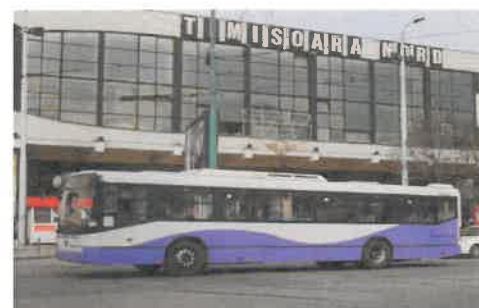
Parc inventar: 55 autobuze Mercedes Conecto (scurte)