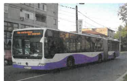
30 autobuze Mercedes Conecto G (articulate)