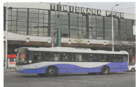
Parc inventar: 55 autobuze Mercedes Conecto (scurte)