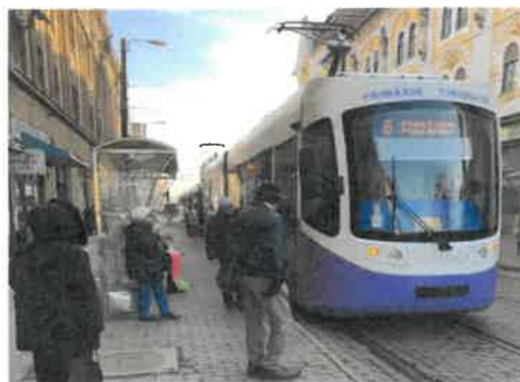
Parc inventar: 30 tramvaie "Armonia" 40 tramvaie germane 3 tramvaie utilitare