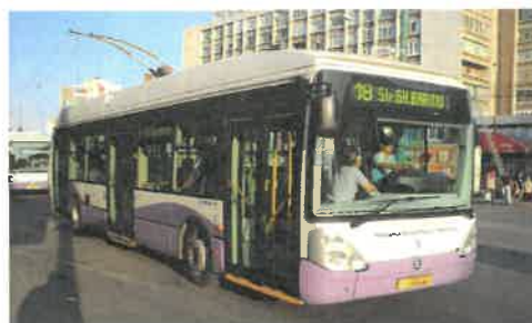
Parc inventar: 50 troleibuze SOLO- SKODA 24 TR IRISBUS