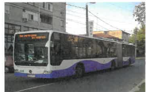
30 autobuze Mercedes Conecto G (articulate)