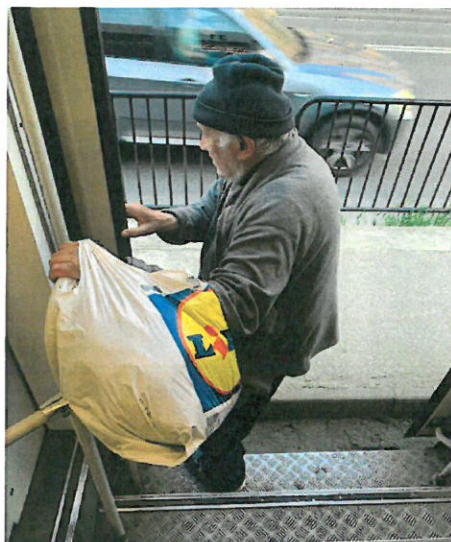
1. Om al strazii coborat din MT