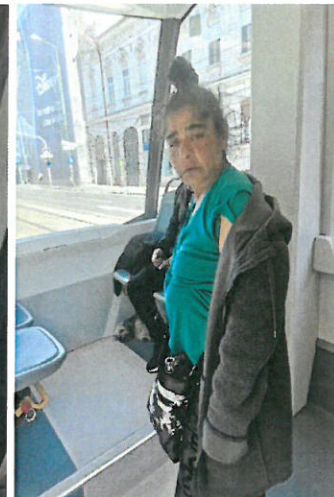
2. Persoane cu caini