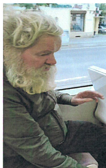
7. Om al strazii coborat din MT