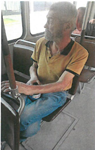
11. Persoane cu alcool si fara titlu de calatorie