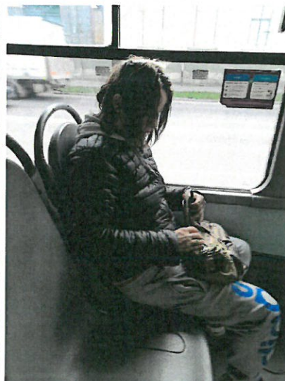
2. Om al strazii coborat din MT