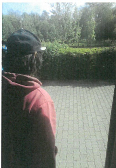
3. Om al strazii coborat din MT