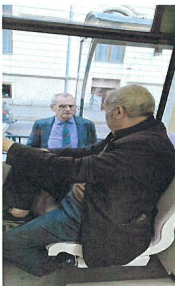
6. Om al strazii coborat din MT