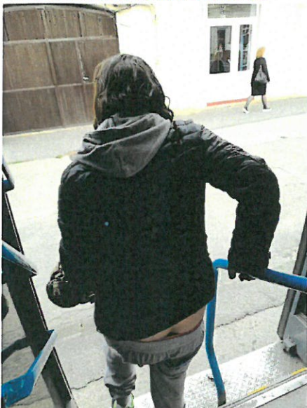
2.1 Om al strazii coborat din MT