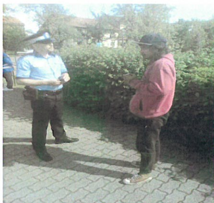
3.1 Om al strazii coborat din MT