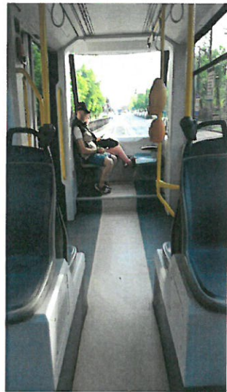
10. Persoana necivilizata