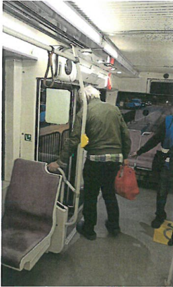
8. Om al strazii