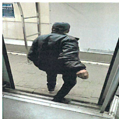
4. Om al strazii coborat din MT